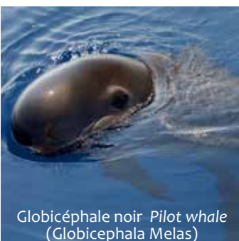
Globicéphale noir Pilot whale ( Globicephala melas )