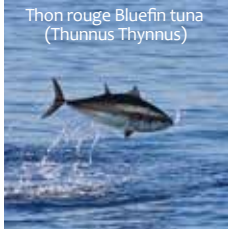
Thon rouge Bluefin tuna ( Thunnus thynnus )