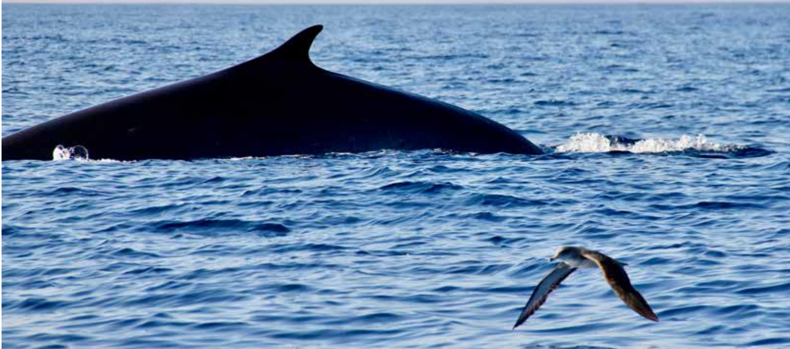
Rorqual commun Fin whale ( Balaenoptera physalus )

La baleine (rorqual commun), qui dépasse les 20 mètres et les 70 tonnes, appartient au sous-ordre des mysticètes. Elle filtre sa nourriture avec ses fanons. Le cachalot est un odontocète. Il se nourrit des calamars géants qu'il chasse avec ses dents à des profondeurs extrêmes. Le souffle de ces grands cétacés se différencie car l'évent (narine) est double chez les filtreurs et simple chez les chasseurs.