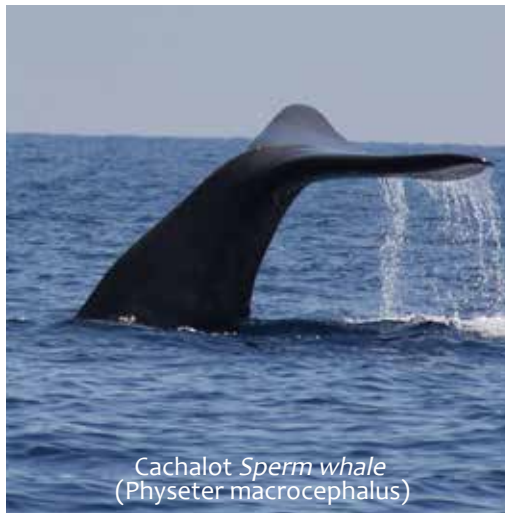
Cachalot Sperm whale ( Physeter macrocephalus )