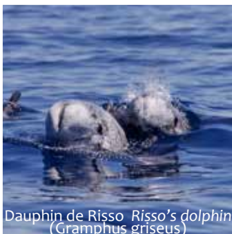
Dauphin de Risso Risso's dolphin ( Gramphus griseus )