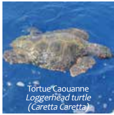
Tortue Caouanne Loggerhead turtle ( Caretta Caretta )

La Méditerranée est peuplée de géants: le rorqual commun (2 e plus gros animal de la planète) et le cachalot (champion incontestable d'apnée). Proches cousins, ils ne font néanmoins pas partie de la même famille.