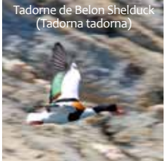
Tadome de Belon Shelduck ( Tadorna tadorna )