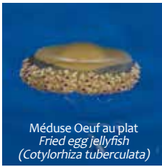
Méduse Oeuf au plat Fried egg jellyfish ( Cotylorhiza tuberculata )