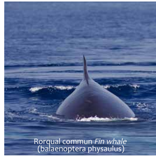
Rorqual commun Fin whale ( Balaenoptera physalus )

La baleine (rorqual commun), qui dépasse les 20 mètres et les 70 tonnes, appartient au sous-ordre des mysticètes. Elle filtre sa nourriture avec ses fanons. Le cachalot est un odontocète. Il se nourrit des calamars géants qu'il chasse avec ses dents à des profondeurs extrêmes. Le souffle de ces grands cétacés se différencie car l'évent (narine) est double chez les filtreurs et simple chez les chasseurs.